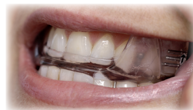
Ästhetisch und bequem